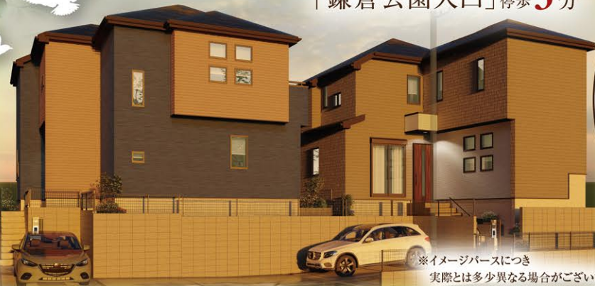
※イメージパースにつき 実際とは多少異なる場合がございます。