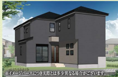
※イメージパースにつき実際とは多少異なる場合がございます。