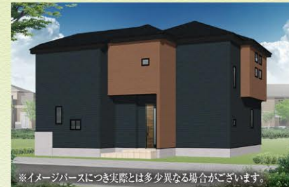
※イメージパースにつき実際とは多少異なる場合がございます。