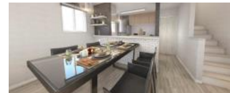
※床材・クロスのイメージカラーです。